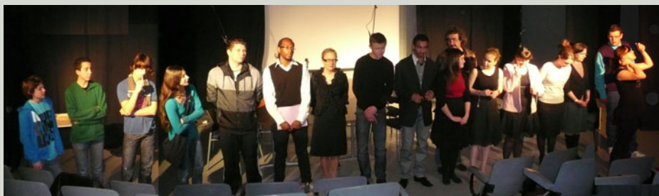
Les acteurs : collégiens de Guillaume de Normandie, lycéens de Jean Rostand et adultes des deux établissements.